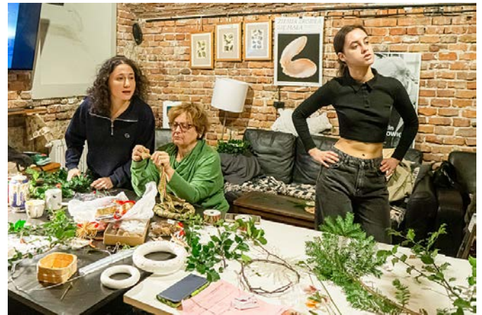
Właśnie odbywa się wieszanie jednego z wieńców, (poza kadrem) a niebawem będzie gotów kolejny.

Pod koniec listopada rozpoczyna się tworzenie ozdób na Boże Narodzenie. W użyciu ostrokrzew, jałowiec, irga, czerwone wstęgi i różne inne ozdoby. Pomysłowość nie zna granic. Większość sukcesywnie wieszano na ścianach i pod sufitem. Część z nich była do wzięcia w ramach kiermaszu.