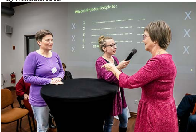
To chyba było czwarte pytanie „famiłady”.

11 listopada c.d. – familiada o Tygodniku Powszechnym – Program przygotowany przez Wspólnotę Indywidualności.