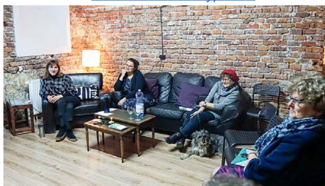
Płynie opowieść o Kleszczowskich Wąwozach

https://www.klubtygodnika.pl/kluby/krakow/ratujmy-kleszczowskie-wawozy/27156