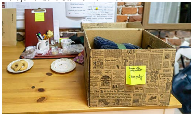
Pudło, do którego zbierano skarpetki.