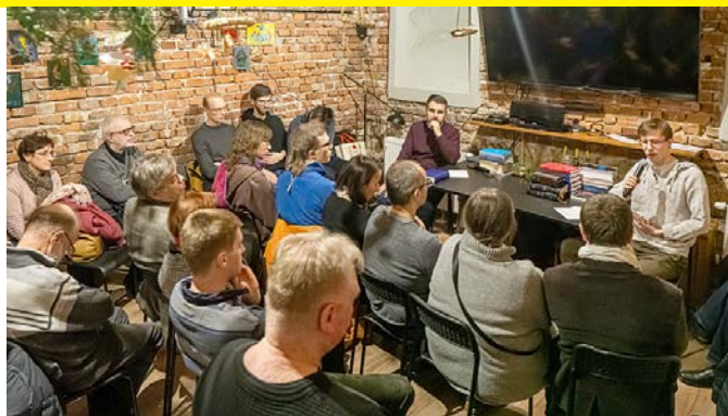
Inauguracja spotkań biblijnych.

Biblia w Piwnicy to planowane 6 spotkań poświęconych kolejnym podstawowym aspektom Biblii.