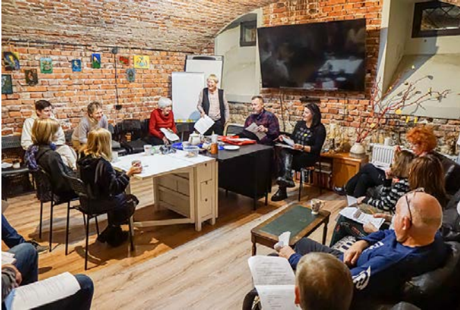
W trakcie próby – śpiew kolędy.

Próby przedstawienia „ Magiczne święta Bożego Narodzenia ” nabrały tempa, obywały się co piątek. Spektakl będzie można zobaczyć 21 stycznia przy okazji klubowego kolędowania.