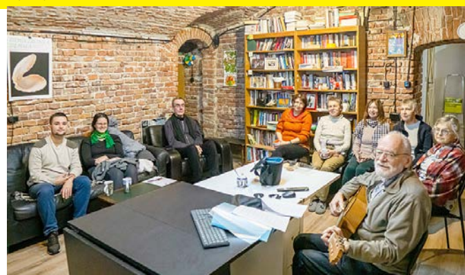
W trakcie śpiewów turystycznych.

26 listopada – W delcie Dunaju – po piosenkach oglądamy zdjęcia z rejsu po odnogach delty Dunaju. M.in. podziwiamy czaple różnych gatunków, pelikany, ibisy, kormorany, mewy i łabędzie.