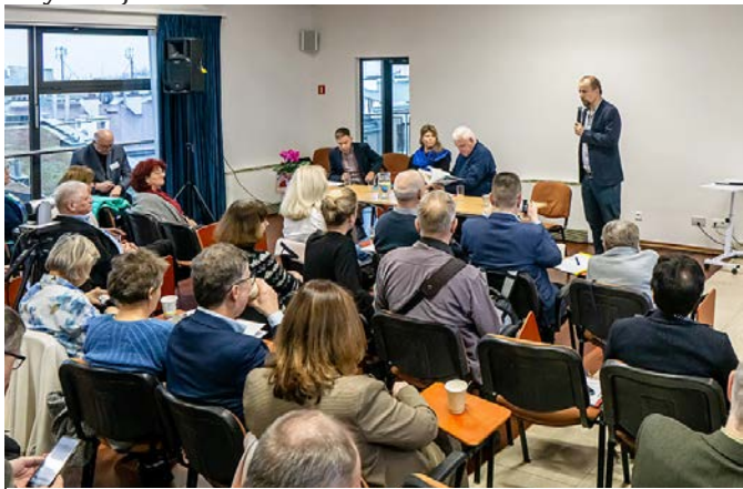
Konferencja „Między faktami a pamięcią”.