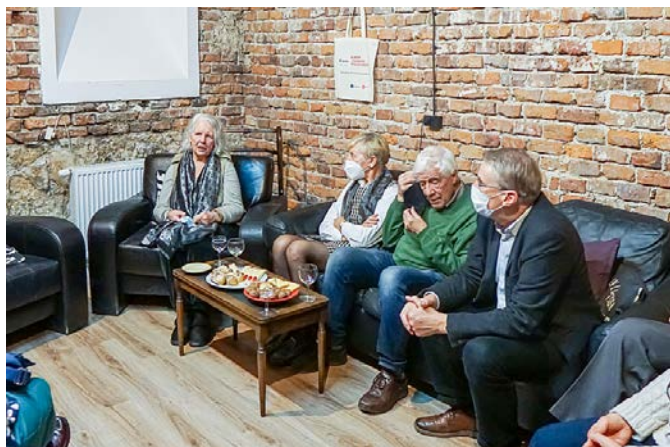
„Ława” naszych mecenasów (fragment).

12 listopada – właściwa, uroczysta inauguracja działalności Piwnicy Powszechnej (foto str. 6). Zaprosiliśmy na nią naszych mecenasów, bez których wsparcia Piwnica by nie powstała ani nie mogła działać.