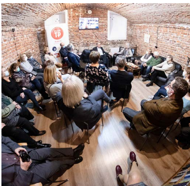
Uroczysta inauguracja w obiektywie Adama Walanusa.