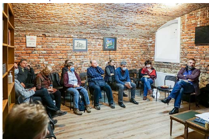
Podczas spotkania Kongresu KiK.