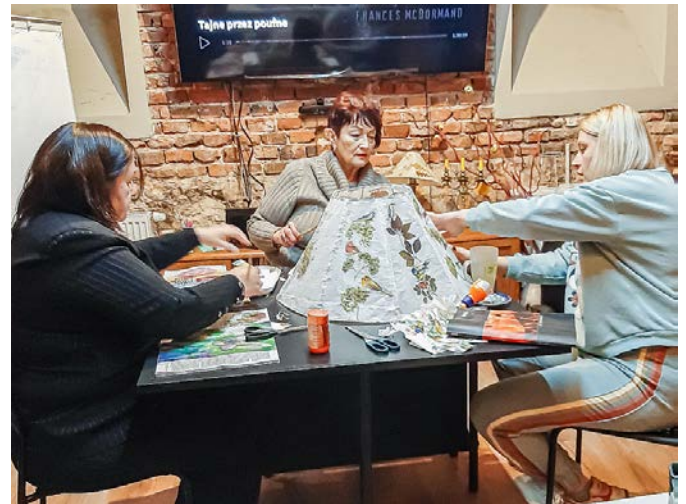
Praca nad jednym z abażurów już bliska końca.