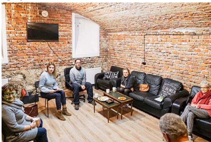
Spotkanie Laudato si' Movement.

4 listopada 2021 – zbiera się w Piwnicy krakowska grupa Laudato si' Movement.