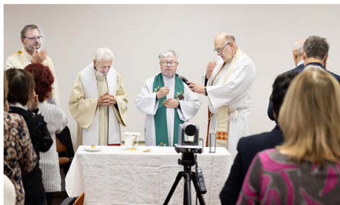
Niedzielną Mszą św.