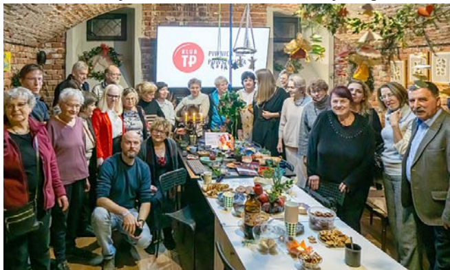
Wspólne zdjęcie na koniec spotkania.

15 grudnia – spotkanie przedświąteczne – składanie życzeń i łamanie się opłatkiem.