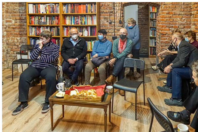
Podczas spotkania rocznicowego.

Dlatego spotkanie 23 listopada 2021 miało być jedynie inauguracją obchodów rocznicy, które miały trwać do 15 stycznia. Ale na nim się skończyło.