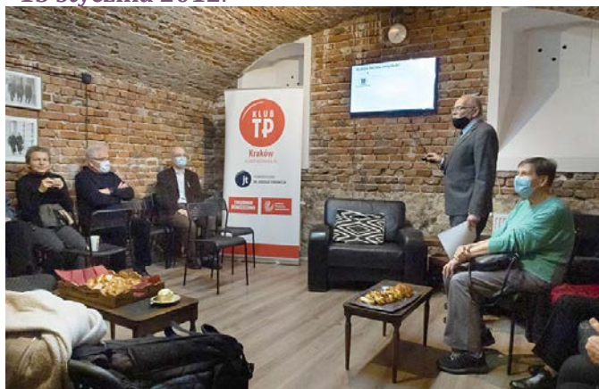
Prezentacja historii Klubu.

23 listopada 2011 ukazał się pierwszy komunikat, że 27 listopada odbędzie się zebranie założycielskie Krakowskiego Klubu „TP”. Po powstaniu Klubu, pierwsze spotkanie klubowe odbyło się w Herbewie 15 stycznia 2012 .