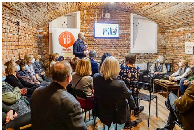
Podczas uroczystej inauguracji działalności 12 listopada.

5 listopada – spotkanie krakowskiej grupy Kongresu Katoliczek i Katolików.